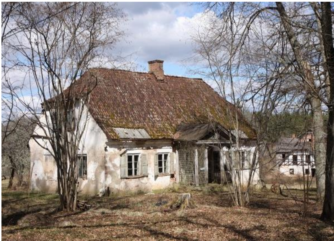
Rencēnmuīžas „Saulieši”, kur kādreiz likti pamati Rencēnu pagasta 2. bibliotēkai.