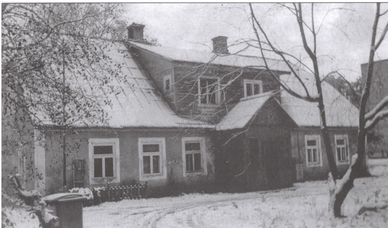
Bijusī Līdzēnu skola. 2003. g.

Sakarā ar kolhoza "Draudzība" kantora štata darbinieku palielināšanos bibliotēkas telpas bija nepieciešamas kantorim, un 1980. gadā bibliotēku pārvietoja uz „Purgaiļiem” Līdzēnu ciemata centrā, bijušās Līdzēnu skolas telpās.