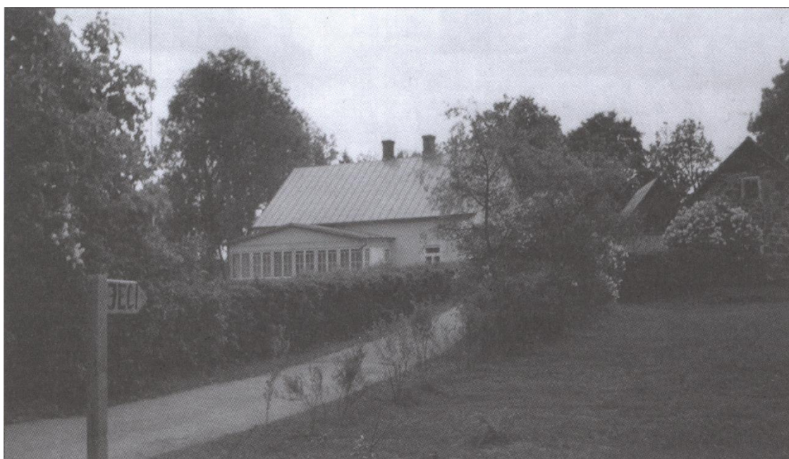
Ječi. 2005. g.

1955. gadā bibliotēka pārvietota uz „Ječiem”, kur atradās kolhoza „Draudzība” kantoris, un nosaukta par Rencēnu ciema 2. bibliotēku.