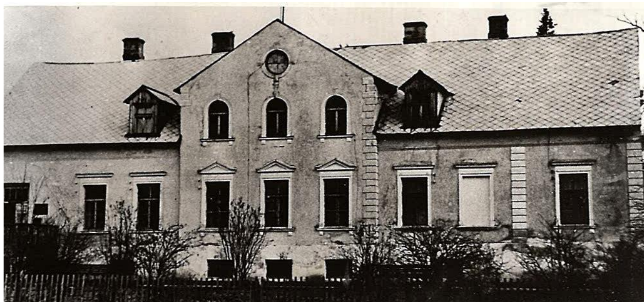
Košķeles muiža, padomju saimniecības “Austrumi” centrs, kur 1968. gadā piešķir telpas Vecates ciema 2. bibliotēkai

70. – 80. gados cilvēki bija ļoti aktīvi grāmatu lasītāji, viņiem patika piedalīties manis rīkotajā pašdarbībā. Nebija jau toreiz vēl ne datoru, ne satelīttelevīzijas, televīzijā reti rādīja labas filmas un interesantus raidījumus. Cilvēkiem patika pulcēties kopā mūsu kopīgi organizētajos pasākumos, tā bija iespēja gan izdejoties, gan izdziedāties, gan iepazīties. Ne viens vien laulāts pāris pagastā ir radies tieši pateicoties šiem vakariem.