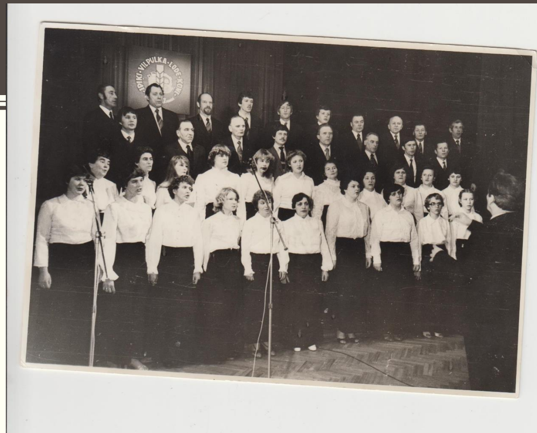
Ipiķu ciema koris