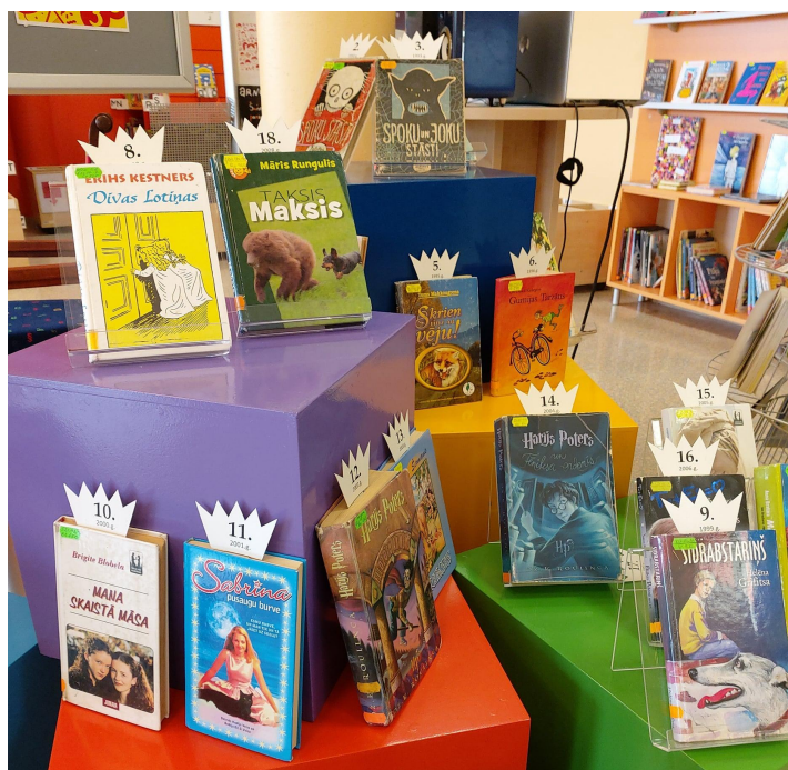
Grāmatu izstāde “Mana grāmatu karaliene - 30 gadi”. BAN ikgadējā konkursa laureātu izstāde. 2021. gada aprīlis.