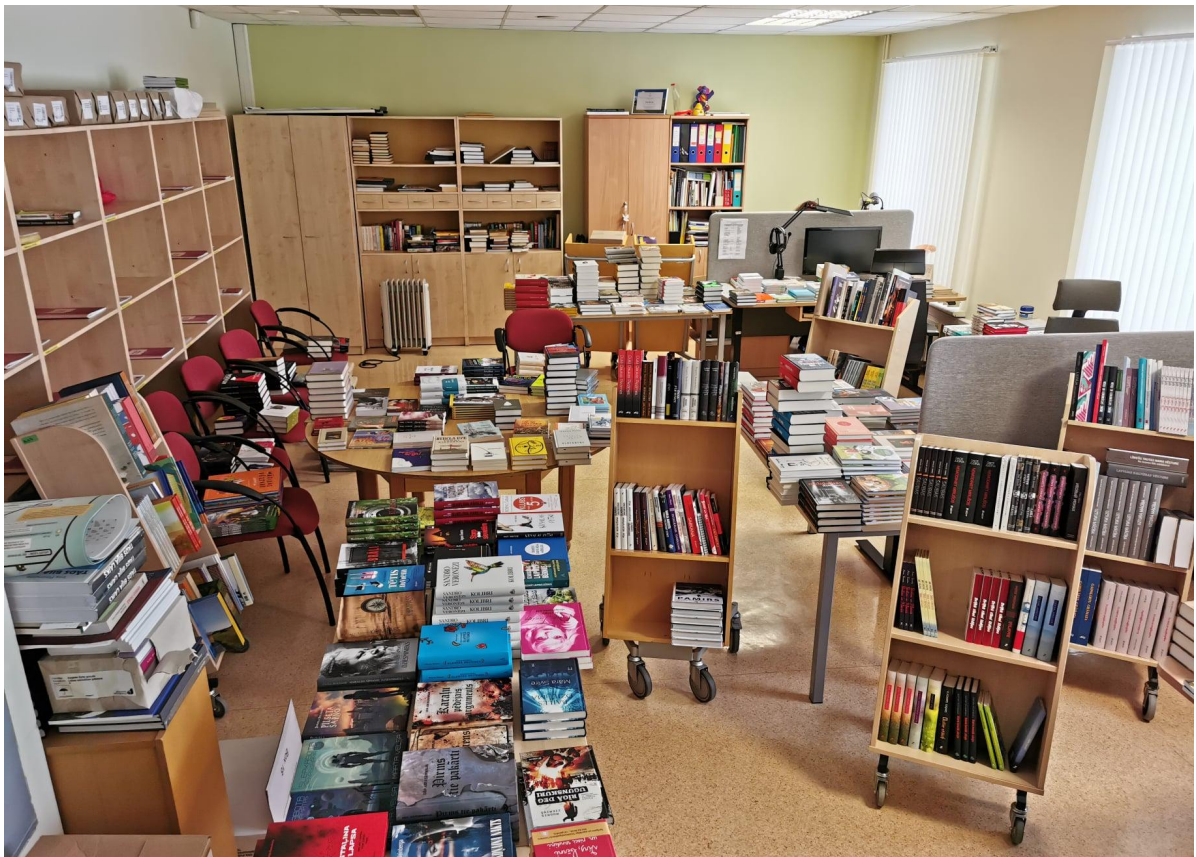
E-grāmatu bibliotēkas 3td aktīva popularizēšana.

Projekta "Grāmatu iepirkuma programma publiskajām bibliotēkām" apjomīgais sūtījums. Saņemtās grāmatas - daiļliteratūra, nozaru izdevumi un grāmatas bērniem - vispirms nonāk Komplektēšanas un automatizācijas nodaļā, kur tiek rūpīgi apstrādātas, lai pavisam drīz iepriecinātu lasītājus Valmieras novada pilsētu un pagastu bibliotēkās. 29.11.2021.