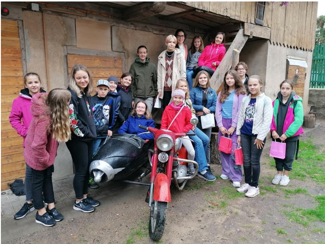
Konkursa “Mana grāmatu karaliene” noslēguma pasākums ar konkursa laureātiem Krāču kaktā “Šķūnī”. 27.08.2021.