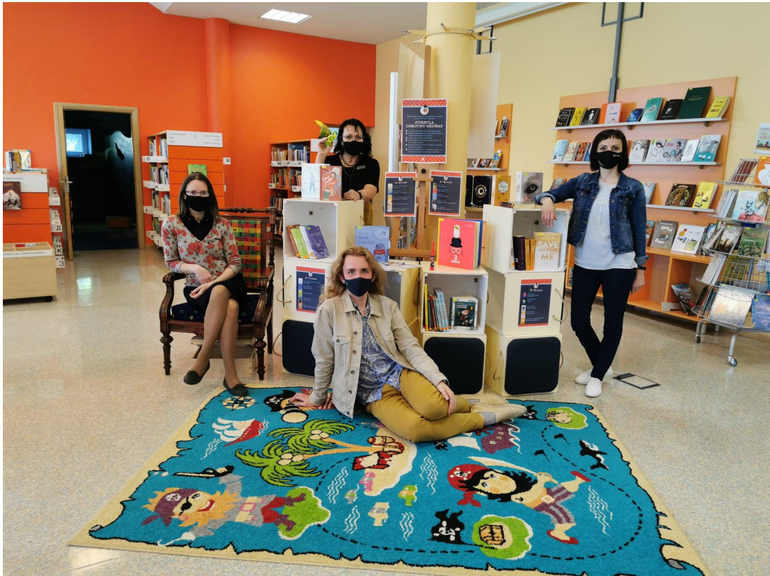
Vasaras lasīšanas veicināšanas programmas “Zvirbuļa dārgumu medības” grāmatu grozi un nodaļas bibliotekāri. 03.06.2021.