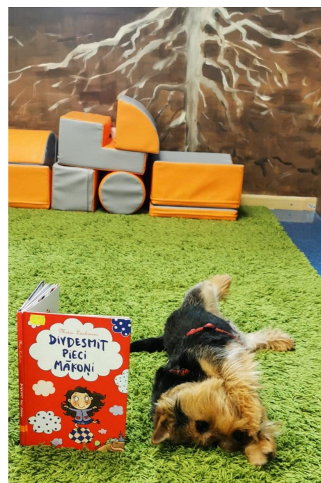
Bibliotekāres palīgs Norvičas terjers Marta programmā “Lasīšana kopā ar suni” bibliotēkā. 20.08.2021.