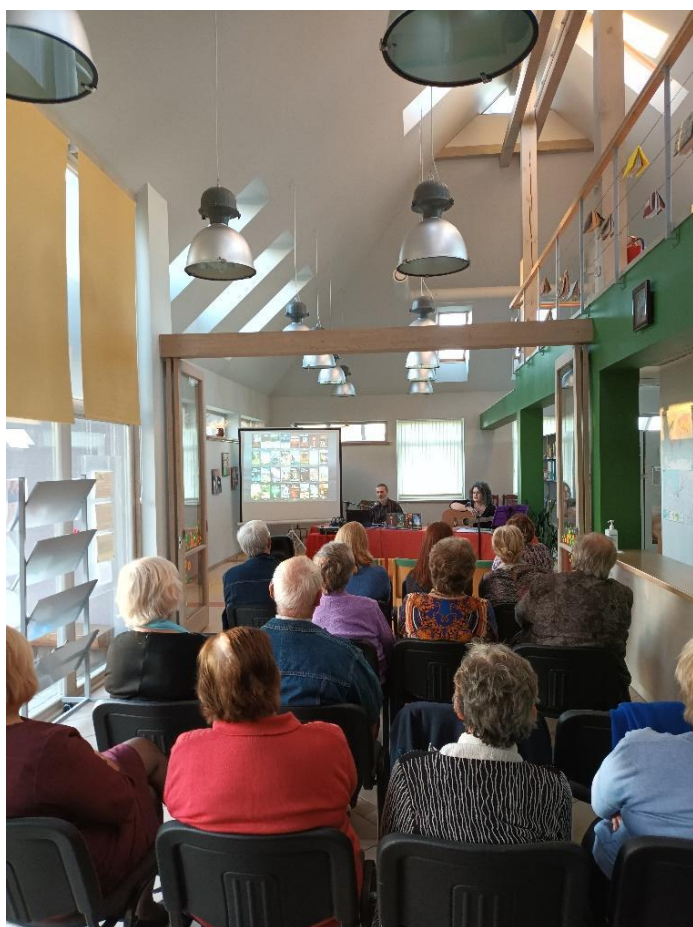
Pasākums Plāņu pagasta Jaunklidža bibliotēkā