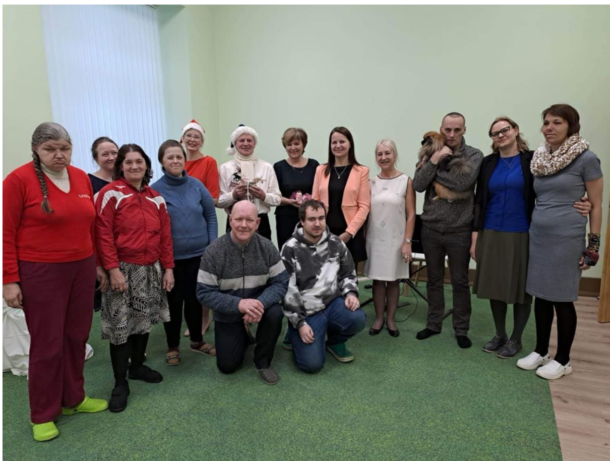
Ziemasvētku koncerts Dienas aprūpes centrā “Laiva” cilvēkiem ar garīgiem traucējumiem 20.12.2022.