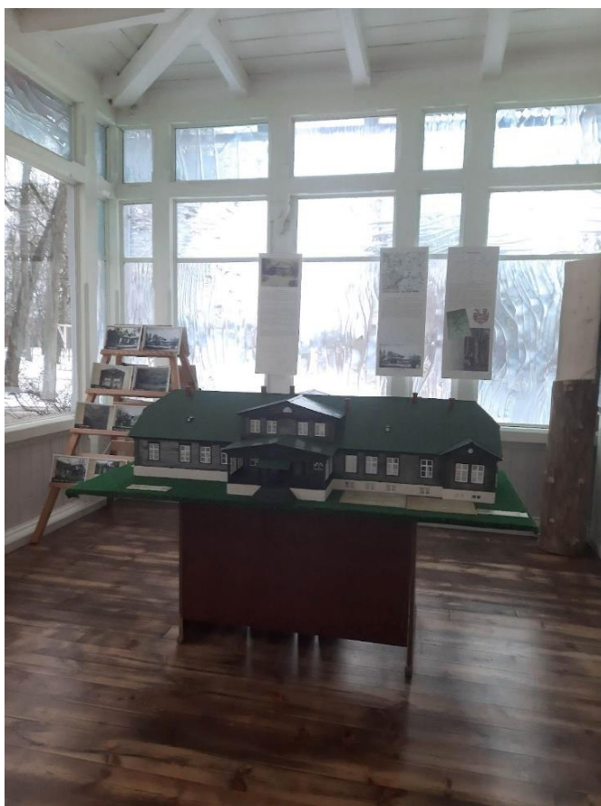
Novadpētniecības izstāde Jērcēnmuižas verandā.