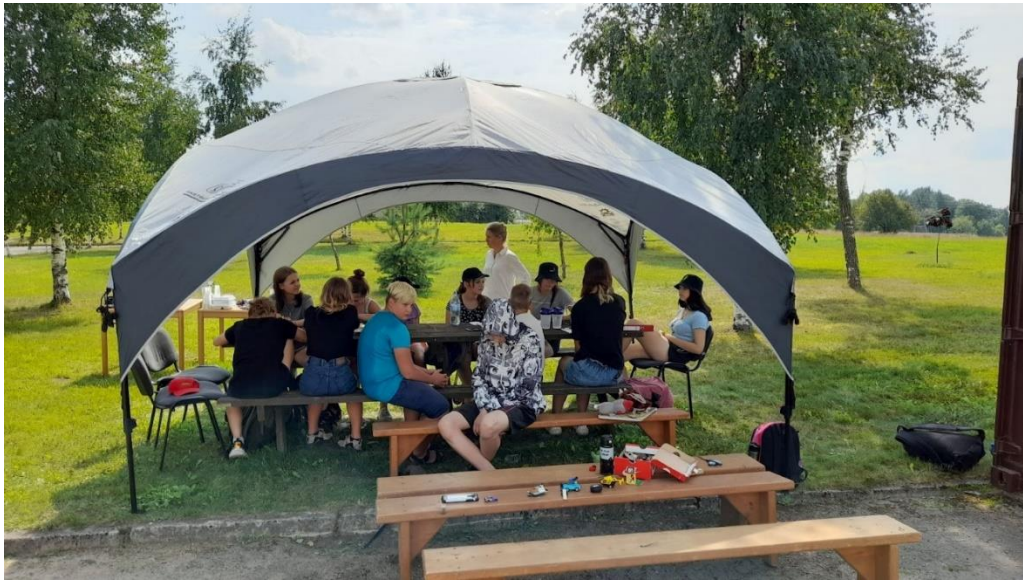
Aktivitātes jauniešiem Vilpulkā