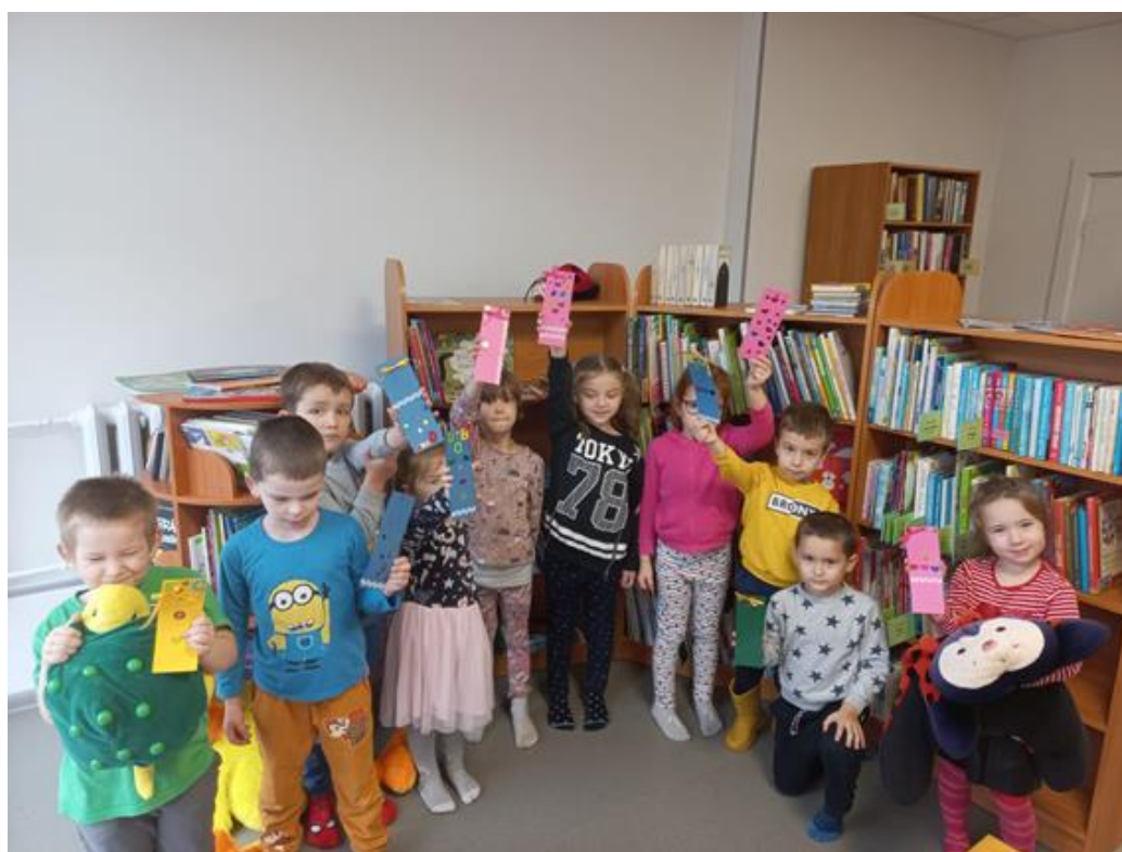
Zilākalna pagasta bibliotēkā