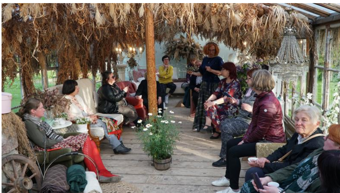
Mazsalacas stāstnieku kopas dalībnieki 6. Vidzemes stāstnieku festivālā “Stāsti krēslā. Ceļos un neceļos” Sedā, Strenčos un Kokmuižā (26.05.2022.)