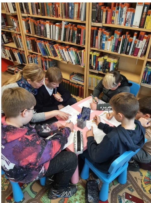
Strenču pilsētas bibliotēkā.