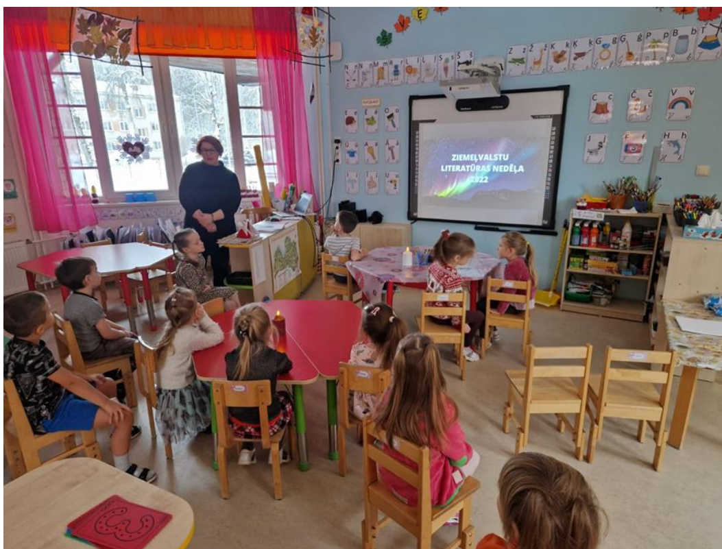
Projekta “Ziemeļvalstu literatūras nedēļa” Rīta stundas lasījumi Mazsalacas PII “Dārziņš” grupiņās (21.11.2022.)