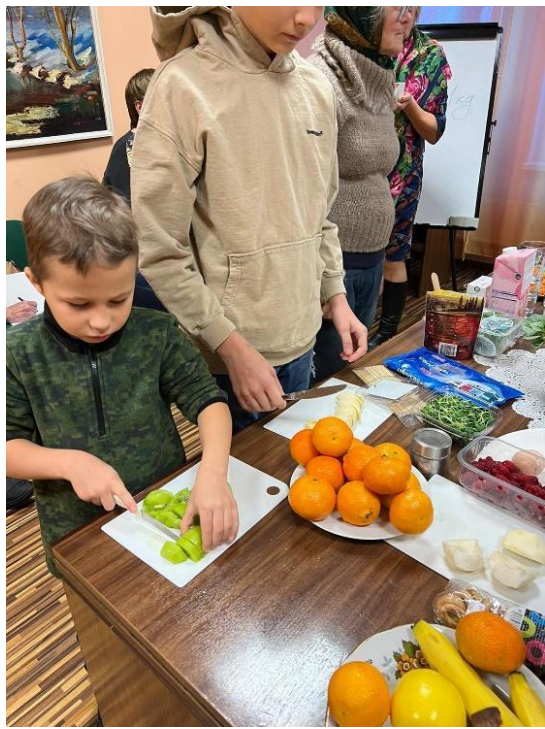
Lodes pagasta bibliotēka. Interaktīvas nodarbības par uzturu “Veselīgas uzkodas līdzņemšanai” un “ Uztura nozīme dažādos vecumos”