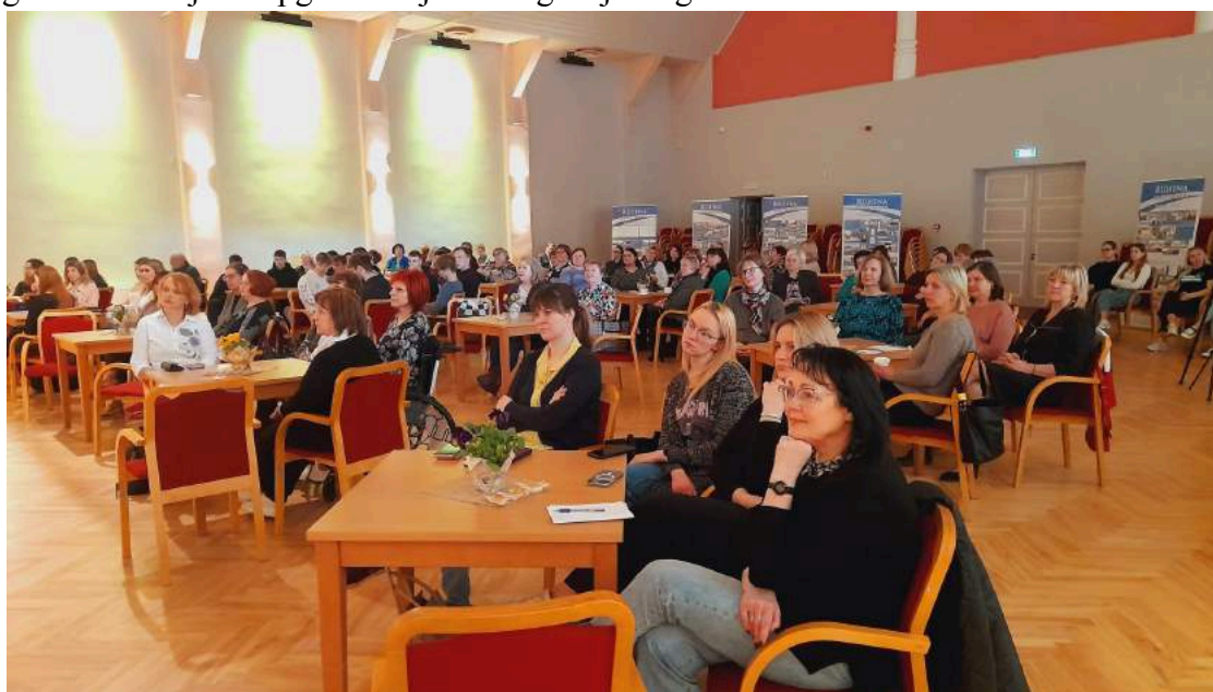
“Latviešu Grāmatai 500” tematisks pasākums Rūjienas kultūras namā "Rūvēnieši – mācītāji, grāmatizdevēji un apgaismotāji".