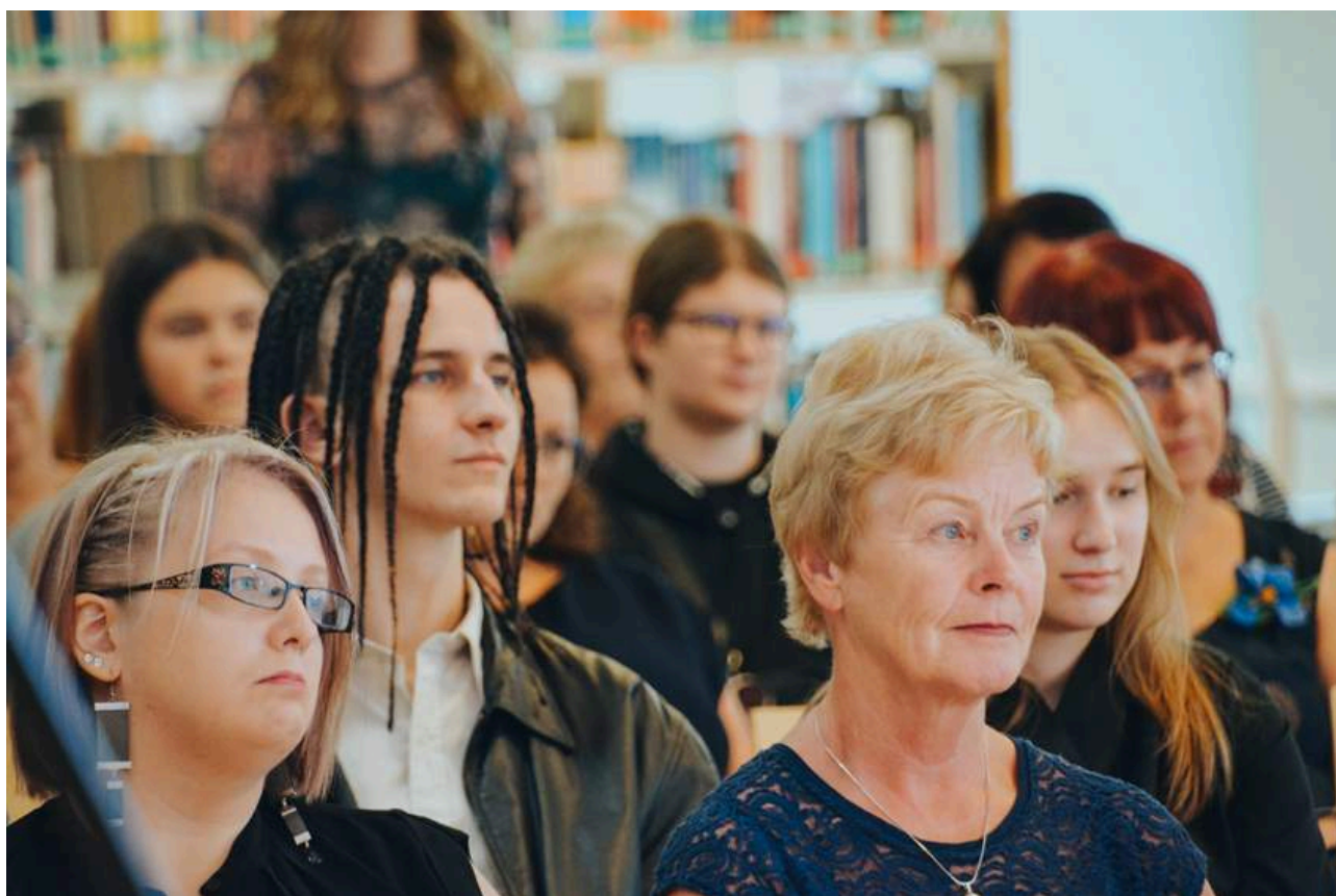
Dzejas diena 2023. Klausītāji Dzejas dienas Autoru vakarā.