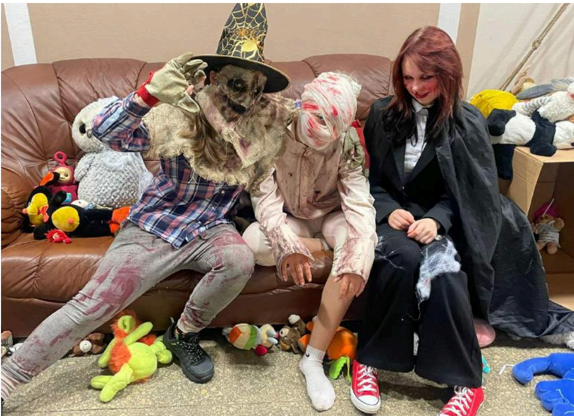
VIBJO “Sudraba ZIRG’s” īstenots pasākums “Šausmas atgriežas II”.