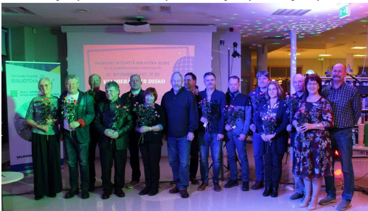
Pasākums VIB "Valmierā skan disko". Valmieras zonālā valsts arhīva pārstāvji, VIB pārstāvji, 70. un 80. gadu diskotēku rīkotāji un stāstu stāstītāji no Valmieras, Mazsalacas, Rūjienas.