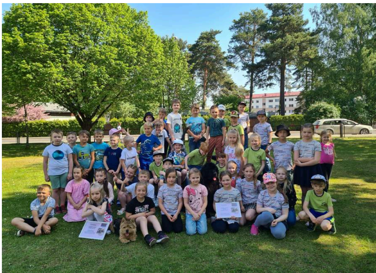
Lasīšanas veicināšanas programma klasēm “Baismīgi jaukais notikums ar suni”.