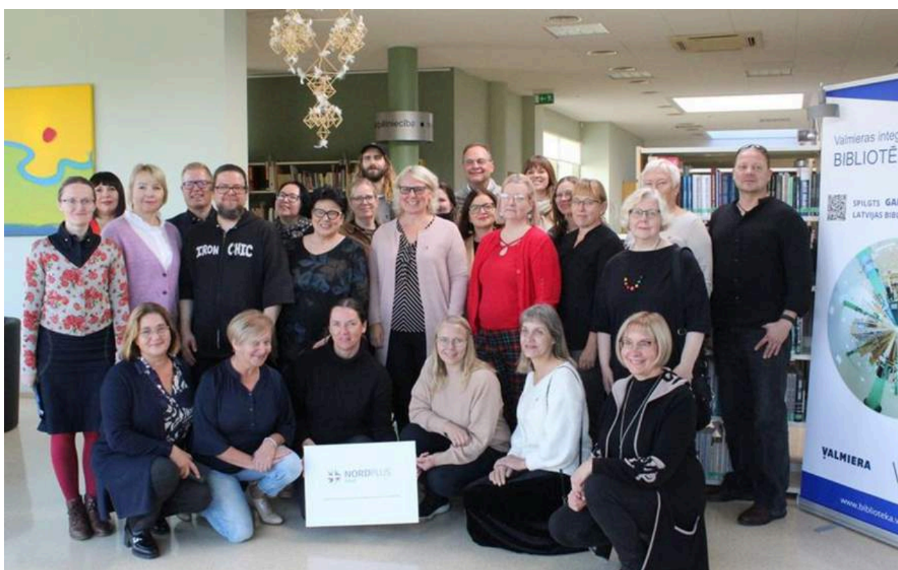
Starptautiskā bibliotēku nedēļa Valmierā, 10.-13.10.2023.