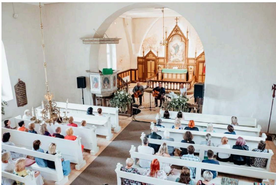
Latviešu grāmatai 500. Indriķa diena Rubenes baznīcā muzicē grupa Lādezers, Aigars Voitišķis un Ingus Ulmani.