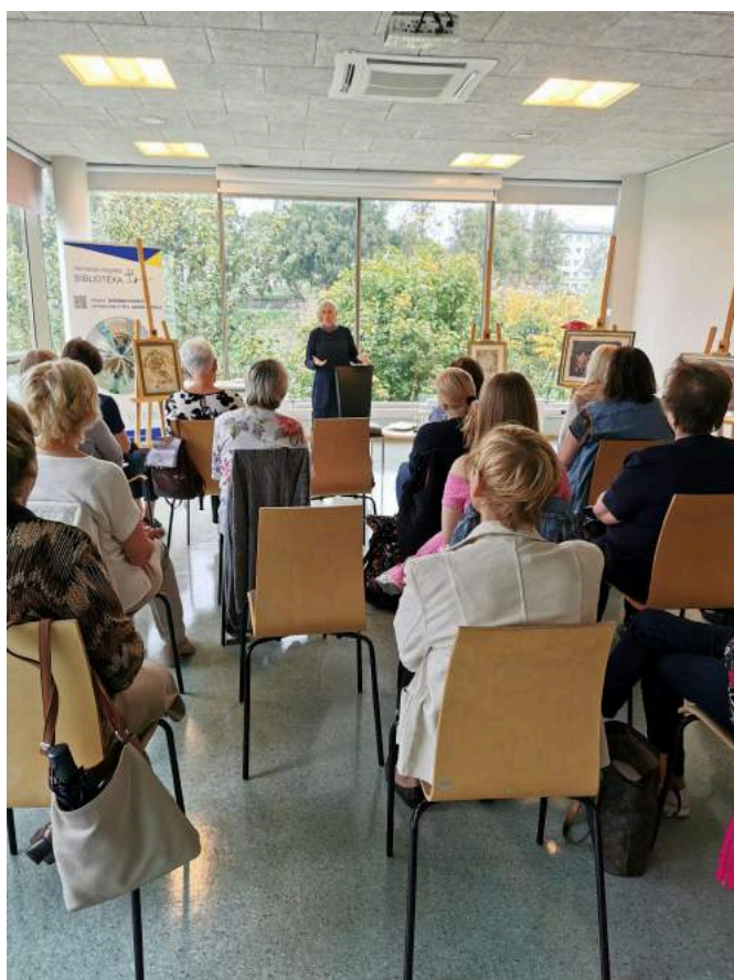
Tikšanās ar Laimu Kotu VIB