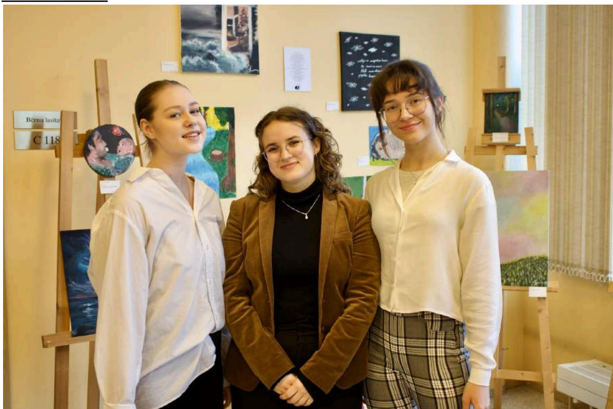
Skolēnu mākslas darbu izstādes “Ilgas pēc...” atklāšanas pasākums.