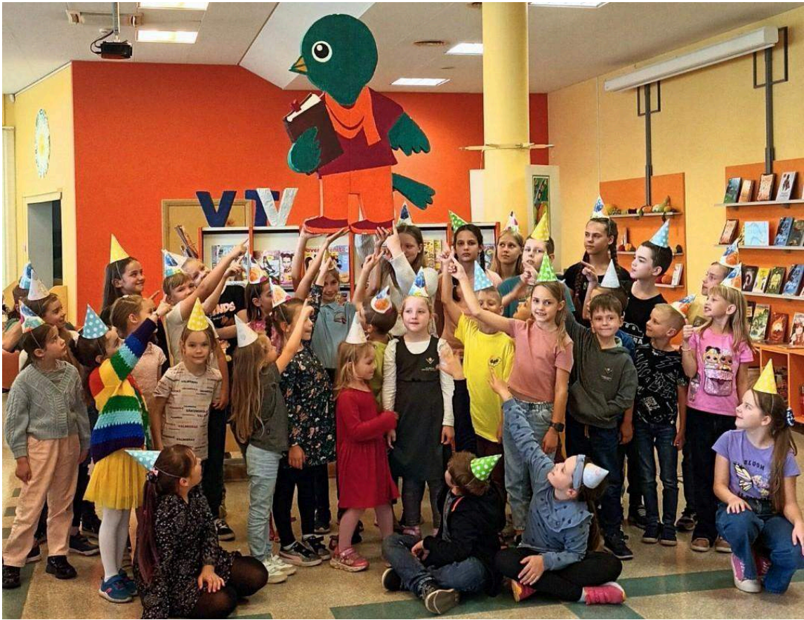
Programmas “Zvirbulis izvēlas profesiju” noslēguma pasākums.