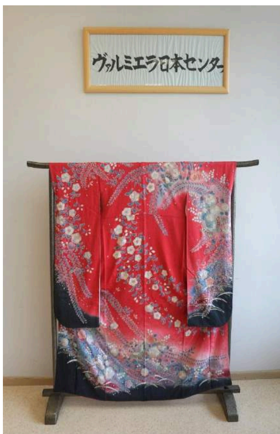
Japāņu telpas atklāšana Valmieras Integrētās bibliotēkas telpās. Japāņu kimono