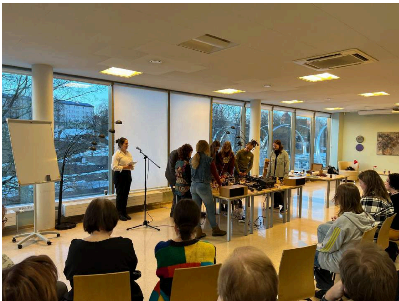
Diskusija ar performanci “Ko tu dari, kad nedari”.