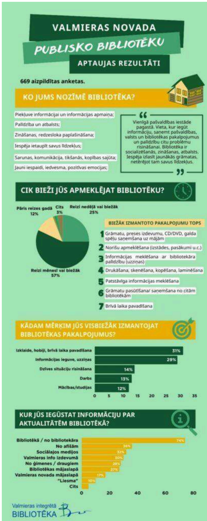
Infografika - lietotāju aptaujas rezultāti.