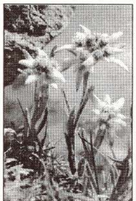
Sācies Adventes laiks. Būsīm tīri domās, darbos un dvēselēs.