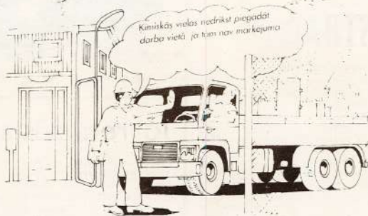
● Zīmējums no grāmatas «Drošība, veselības aizsardzība un darba apstākļi».

prasmī un veiksmī izrādīja pavisam sešas komandas, diemžēl, 12. ceha novusīti nenospēja līdz galam, tāpēc arī vietu neizcīnīja. Rezultāti ir sekojošie: uzvaru guva 17. ceha komanda, otrā vietā ierindojās 4. ceha 2. maiņas parštāvi, trešā — 19. ceha komanda. Ceturto un piekto vietu ieņēma attiecīgi 7. ceha novusīti un 2. ceha 2. maiņas komanda. Kā veiksmīgākos novusis-