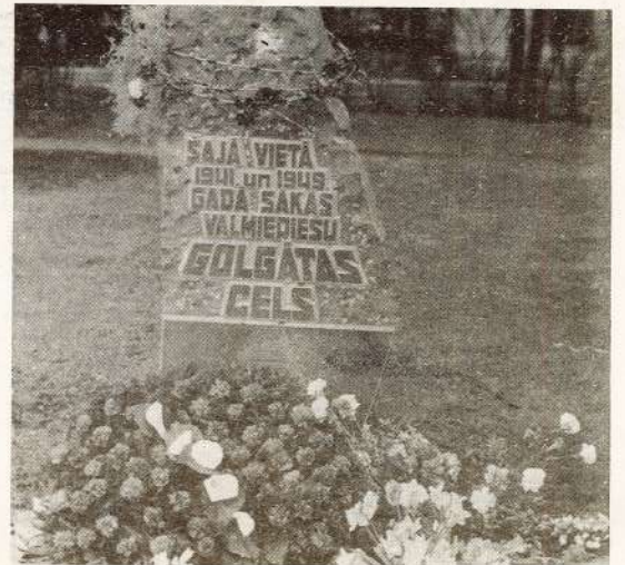
● 2. ceha operatora MĀRA DAMBJA foto.