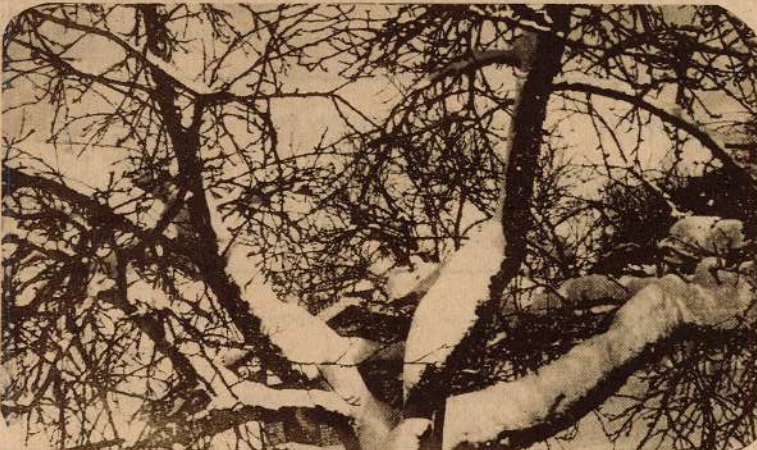
● PALĪEC SVEIKA, ZIEMĀ! UZ REDZĒŠAVOS ATKAL!

kinoamatieru studijas «Kristins» vadītājs