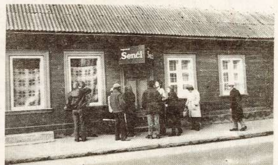
Dažas minūtes pirms jauna veikala atvēršanas.