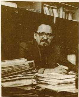
(Sākums 1. lpp.)

vām un steidzinašanu; viens objekts jāpabeidz līdz tādai jubilejai, otrs jāpabeidz līdz tādaiem svētkiem utt. Man, kā galvenajam enerģētīķim, jāzīstas, ka ne vienu reizi vien kārtējais objekts bija jānodod ekspluatācijā ar nesakārtotu apsildi, ar aukstām telpām, ar visu enerģētiku sfera ietilpstošu prasību nepilnīgu izpildi. Daudzi trūķumi līdz šim nav novērti, kaut vai tie paši caurie jūmti. Ik gadus runājam par gatavošanos ziemai, par siltuma saglabāšanu, elektroenerģijas ekonomijas nepieciešamību. Bet vai tad tādas paneļkās, pie jādām durvīm un logiem var siltumu pilnībā saglabāt. Esmu jau stāstījis par Zviedrijas pieredzi, kur pašos pamatos ir cita pieredze