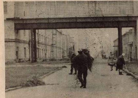
Spolētavas dienas maiņas spēkiem sakopta daļa teritorijas.