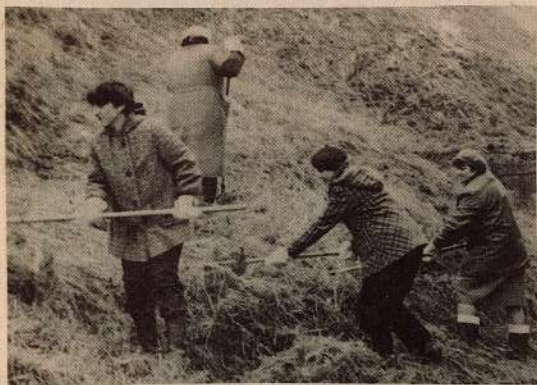
Par to, lai ikviena strādājošā acis priecētu tīrība un kārtība visapkārt, rupejas arī plaša patērēja preču ražošanas ceha strādnieces.