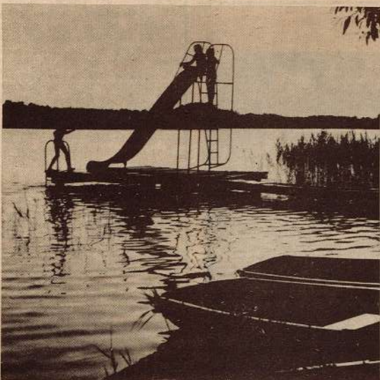
● Atpūsties aicina atpūtas bāze «Augstroze».

Pagājušajā gadā no republikas plašā fotoamatieru pulka darbiem seši fotoattēli tika nosūtīti uz humora centru Gabrovu Bulgārijā. Izvēlēto darbu vidū bija arī «Sūņa prieks» (attēls pa labi).