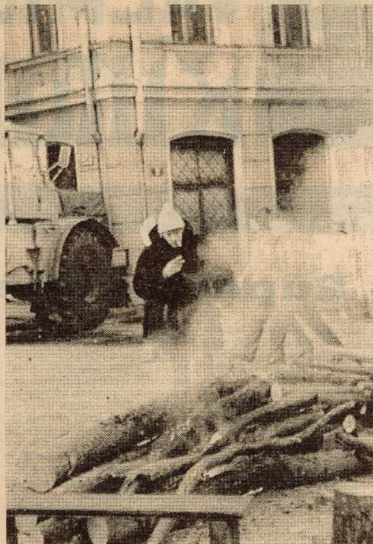
Laiks, kad mēs visi bijām dvēselē skaisti un gaiši, un varējām lepoties cits ar citu un katrs ar sevi... 1991. gada janvāris. Barikāžu laiks. Plecu pie pleca. Visi. Vienoti. Dažādu tautību pārstāvi. Atmiņas nezūd. Svētas. Ari rūpnīcas laudis bija tur, Rīgā. Cēla barikādes, dežurēja dienu un nakti. Pajautājām barikāžu dalībniekiem – kā rihotos, ka līdzīga situācija būtu tagad – šodien? Atbildes visiem skanēja vienādi – par Latviju ietu, brauktu, stāvētu un cīnītos. Tēvzeme ir tikai viena. Par valdību? Nē, nekad! Katru gadu janvāra dienās neaizmirsīsim šo tautas saskaņas laiku, atcerēsīmes arī kritušos par Latvijas brīvību...