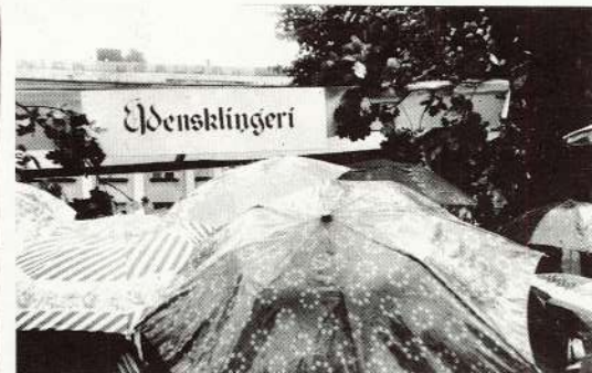
Pie šī stenda visvairāk drūzmējās pircēji, jo te bij' manta, kam lietus reskādē un ko varēja iegādāties vēl bez vizitkartēm...