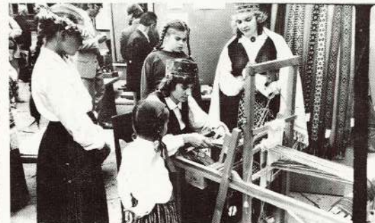
Dažas Valmieras zeltēnes paslepen centās apgūt šo to no Lielvārdes jostu audeju noslepumiem, jo pašu rokām darinātais vienmēr ir vērtīgāks par tirgū pirktu...