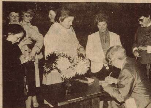
Daudz bija to, kuri vēlējas iegūt Zigmunda Skujiņa autogrāfu.