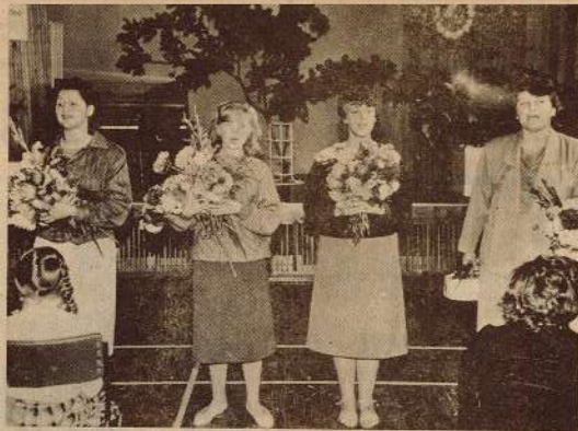
Kur vien notiek kas interesants un ievērojams, tur klāt arī mūsu folkloras ansamblis «Daina». Pagājušajā nedēļā centrālajā bērnu bibliotēkā dzejas pēcpusdienā «Kopā ar tautasdziesmu», vēlti jaunāko klašu skolēniem, dziedātājas aizrāva mazos klausītājus ar tautas dziesmām. Par to viņām no bērniem — dāsnī ziedu pušķi.