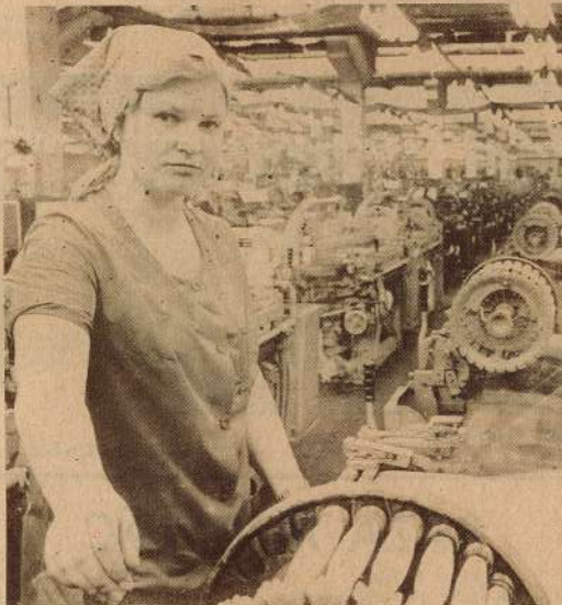
Uz atspolu stellem strādā vispieredzējušākās audejas. Attēla: Ingrida Jarceva.

filmu un koncertu bagātināti svētki. To norīse piedalījās lielā kolektīva parstāvji no visām mainām un nodalām.