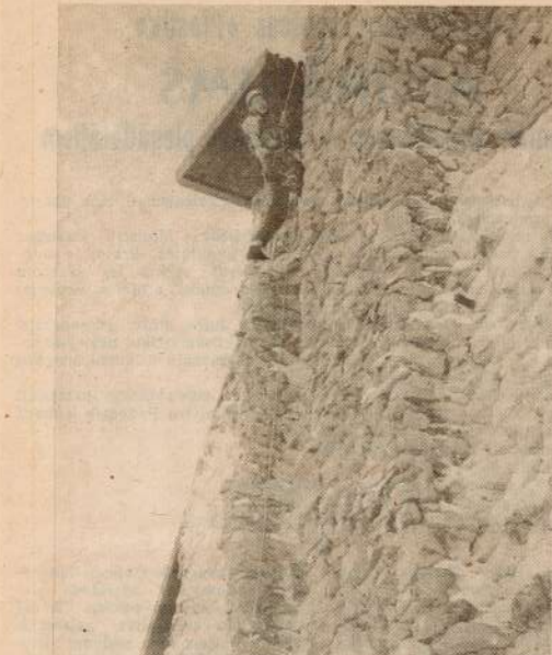
Valmieras rajona tūristu kluba kausa izciņa KLINSU KĀPSANA notiks Baļņu kalnā 3. un 4. oktobrī. Startis 3. oktobrī pulksten 12. 4. oktobrī — pulksten 10.