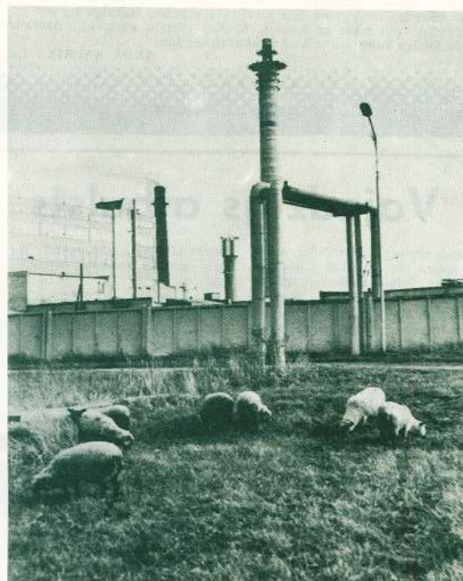
Kāda miermīlīga noskaņa: atīpas uz ķīmijas giganta fona. Tomēr tā aicina domāt par to, cik tuvi mēs esam dabai un cik tuvu dabai — mums.