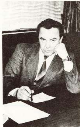
© Pie mums viesojās PSRS lidotājs kosmonauts LEONĪDS POPOVS.

Sarunu gaitā tika risināti arī jautājumi par produkcijas piegādi patērētājiem, tajā skaitā arī aviācijas rūpniecības ministrijai. Sajā sakarā rūpniecība bija ieradus arī PSRS lidotājs kosmonauts Leonīds Popovs un citi vairāki nozaru speciālisti.