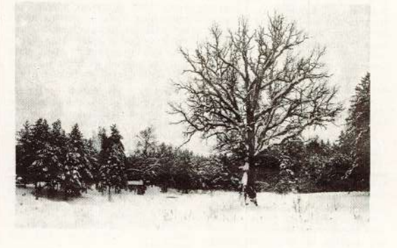
7. ceha krāsotāja Artūra Rundēja foto

Rīt, 24. janvāri pulksten 15 administrācijas sēžu zālē notiks arodkomitejas sēde. Ierasties arodkomitejas locekļiem un cehu komiteju priekšsēdētājiem. Arodkomiteja aicina pieteikties ārzemju tūrisma braucienam uz Bulgāriju jūlijā. Tuvākas ziņas cehu komitejās. Svētdien Baiļkalnā notiks tradicionālā «Liesmas» kausa izcīņa stafēšu slēpojumā. Aicināti visi interesenti papildināt līdzjutēju pulku.