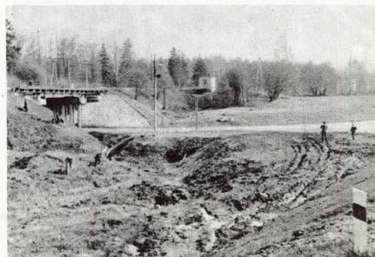
⊙ Tuvojoties rūpnīcai, paveras skats uz šobrīd jau sakopto apkārtni. Arī šeit, kur 12. ceha vīri ar smago transportu bija sadangājuši ceļmalas.