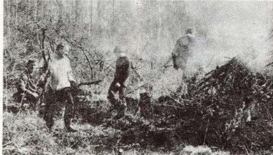
© Kopā ar visiem — direktors Inārs Pofaks.