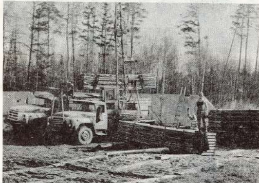
© Ne tikai apkārtnes labiekārtošanai, bet arī celtniecības darbu veikšanai tika atvēlēts darbs. Šie paneļi ceļos uz būvlaukumu.