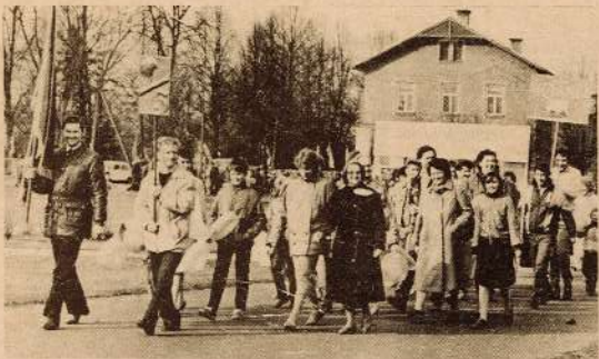
SVĒTKU DEMONSTRĀCIJAS KOLONNA — ARI MŪSU RŪPNĪCAS STARPČEHU SOCIĀLISTISKĀS SACENSĪBAS UZVĀRĒTĀJS — 5. CEĻA KOLEKTĪVS.