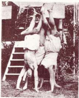
Loti sportisks priekšnesums nepat notikušajos svētkos.