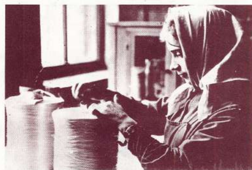
MUDITES LIEPIŅAS pirmie darba gadi.

Lai man piedod tie jubiliāri, kuri nav nosaukti vārdos, katra darba mūžs ir vienreizēja lappuse rūpnīcas vēsturē!