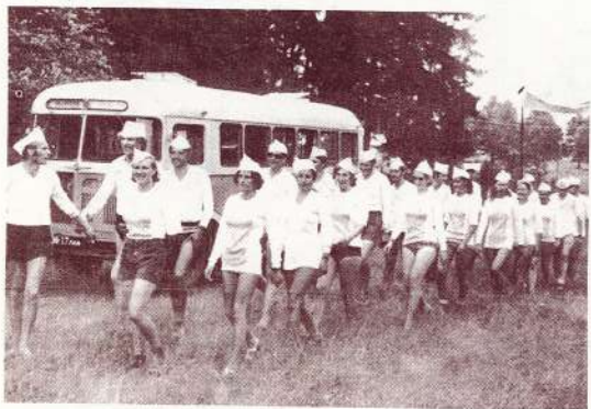
Viena no pirmajām «Jumarām».