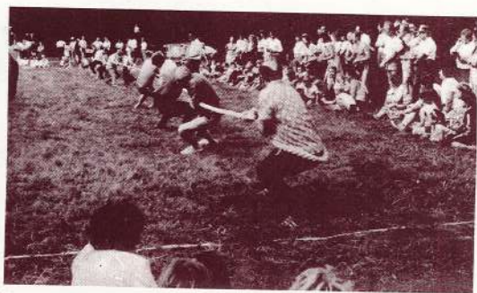
Virves vilkšanas sacensības vienmēr pulcina daudz skatītāju.

Varētu rīkot jautras, sirdij tīkamas un kolektīvus vienojošas sacensības, un, ja vēl būtu no abām pusēm tāda vēlēšanās, droši var teikt, ka tās izdotos. Dalībnieku skaits Jumarās svētkos ir diezgan stabils. Ir bijuši gadi, kad piedalījušies 600 cilvēki, pēdējos gados skaits ir svārstās no 400 līdz 500. Cilvēki pie šiem svētkiem ir pieraduši. Diemžēl, vakaros vairāk jānogemas ar kārtības uzturēšanu Valmieras jaunīšu dēļ. Domāju, ka šī tradīcija nav no tām, kas izbeidzas. Vienmēr maiņu kolektīvi tai nopietni un pamatīgi