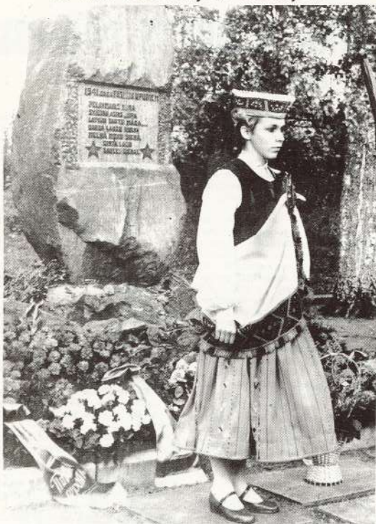
PIEMINĀS MIRKLIS ĶELDERLEIĀ.