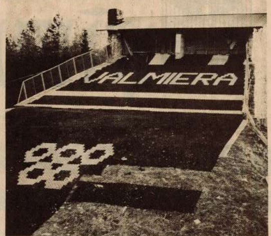
● Top slaloma trase ar mākslīgo segumu, kas saņemts no Čehoslovākijas.