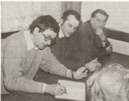
● Čehoslovaku speciālisti izteica savus priekšlikumus par sadarbību.

Valmieriešu delegācija savukārt devusies uz Čehoslovākiju.