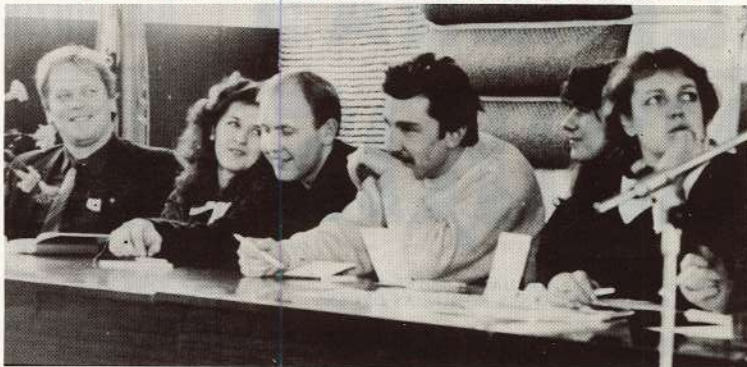
● Konferenču darba prezidijs.