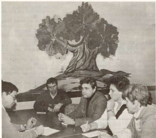
● Ko teikt sadarbības aspektā bija arī mums.