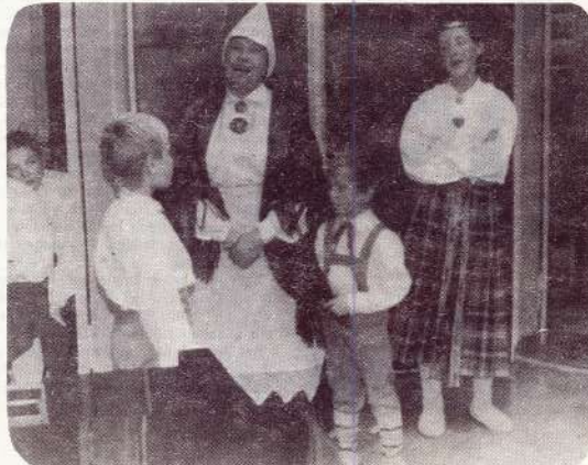
● Selecki — «Valmieras pastalnieki».

savu partneri Vairi iedejoja ģimēni), nekad nav atteikusies darboties arī cēha labā. Kurš gan neatceras Pastnieku, kad parādījās «Valmieras Kimiķis», neviens karnevāls ne-