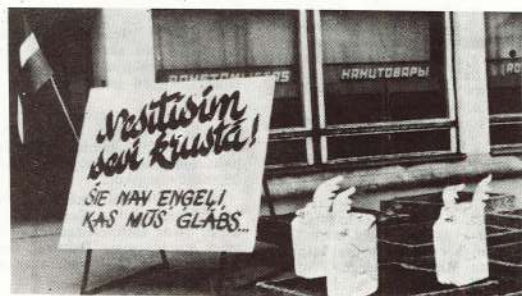
● Tāda nostādne ir daļai valmieriešu.