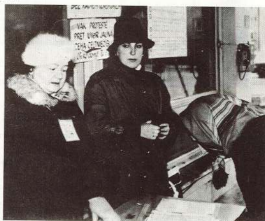
● Vides aizsardzības klubs savācis jau turpat 6000 parakstu pret jaunā čeha celtniecību.

Viens no galvenajiem jautājumiem, kas palabina uztrauc valmieriešus: būt vai nebūt ugunsdzēsības iekārtu rūpnieciskajam ražotnē arpus Valmieras Daudz par to diskutēts, lasīts rajona laikrakstā. Galavārds vēl jēgama.