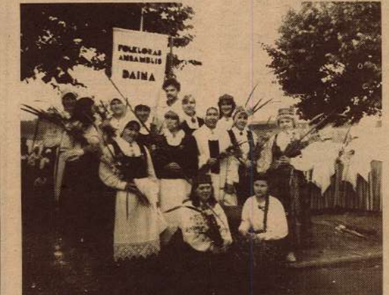
«Daina» Daugaviņas matīņa pirms došanās gājienā.

ausānas ceha kultūras darba organizatore