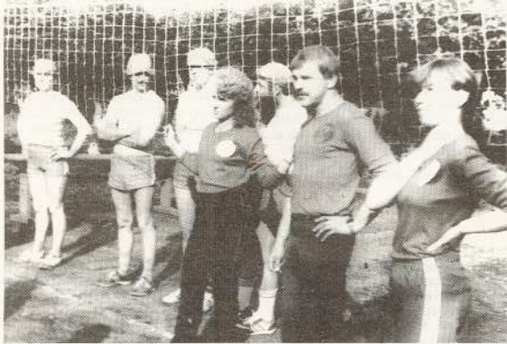
● Pirms sacensību sākuma, 2. ceha un apvienotā komanda.