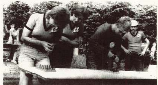
● 4. ceha un apvienotās komandas locekļi sacensībā pielādē aptveri.

Bet pēc tam līdzjutējiem rūpju netrūka, vajadzēja koncentrēt uz-