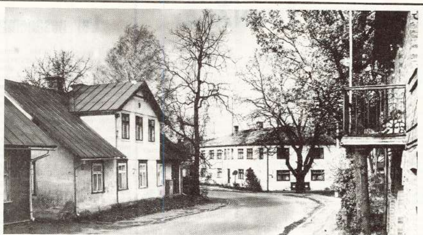
Kur ir tā iela, kur ir tas nams?