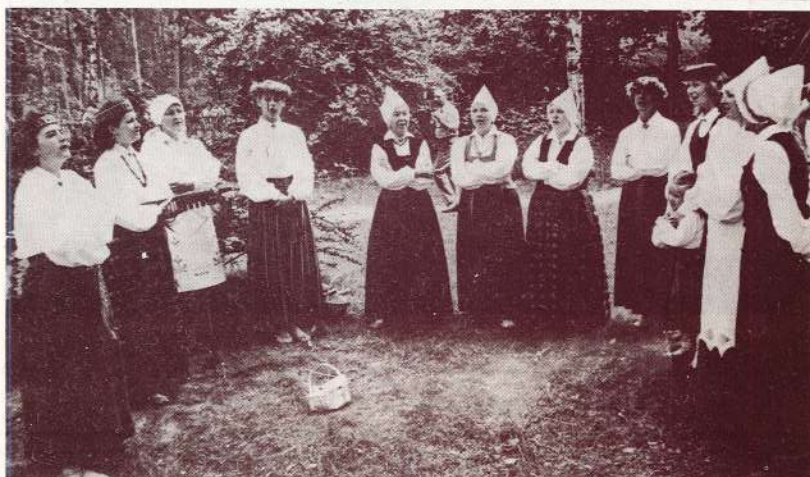
© Mūsu rūpnīcas folkloras ansamblis «Daina» starptautiskā festivāla «Baltica-91» dienās.

Rūpnīcas 1. ceļā nodota ekspluatācijā un sekmīgi darbojas automātiskās svēršanas sistēma, lieviesta sistēmas pirmā kārtā — notiek automātiska svēršana un rezultātus atspoguļo gaismas indikators. Rūpnīca plāno kopīgi ar PSRS Zinātņu Akadēmijas informācijas problēmu institūta Berdjanskas filiāli jau šogad īstenot automātiskās svēršanas rezultātu iegūto datu ieviešanu personiskajās ESM. Sistēma dos iespēju apstrādāt informāciju tās iegūšanas vietā un operatīvi izdot ceļā un rūpnīcas dienestiem gatavu dokumentu veidā.