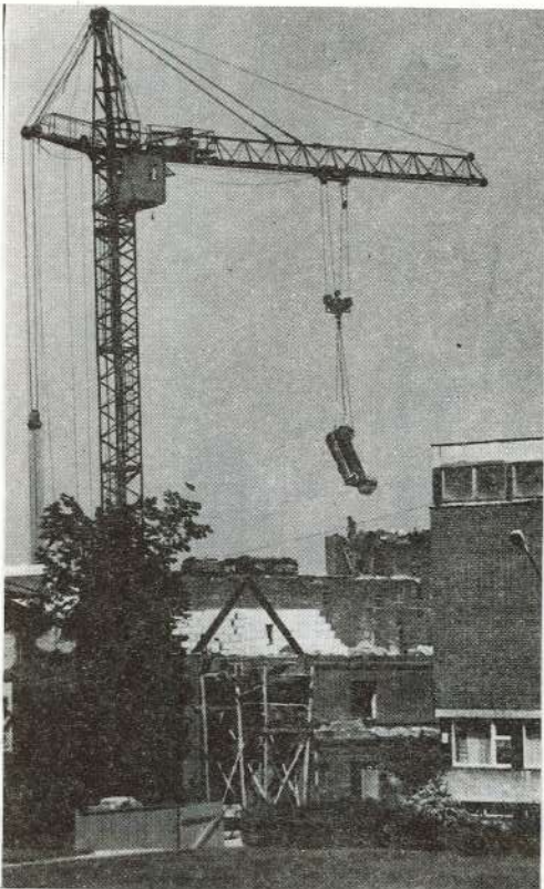
● Top Valmieras teātra jaunā ēka