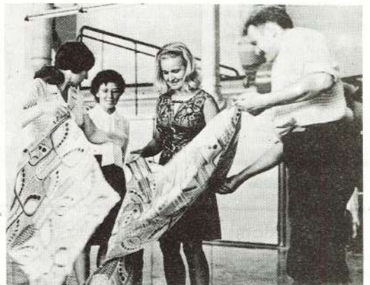
● Pirmie dekoratīvā auduma metri tika saražoti 1972. gada jūnijā.