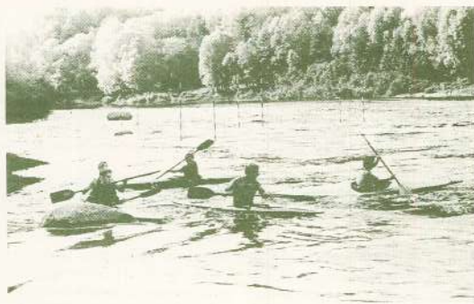
Pirms sacensībām — treniņi.