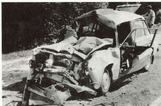
● Lūk, pie kā noved transportlīdzekļa neuzmanīga vadīšana.