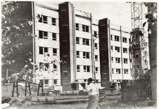
⊙ Jaunajā 60 dzīvokļu mājā, ko rūpnīca cēl saimnieciskā kartā, rīt iekšējas apdares darbi. Šajā jaunceltnē Georga Apīna ielā strādā kooperatīva «Gauja» celtņieki.