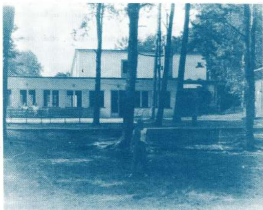
● Nometne «Grotņiki»