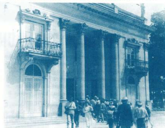
● Varšava. Karaja vasaras rezidence Łazienku parkā.

Pēc tam sākās diskotēka... GITA un AIRITA (Turpinājums sekos)