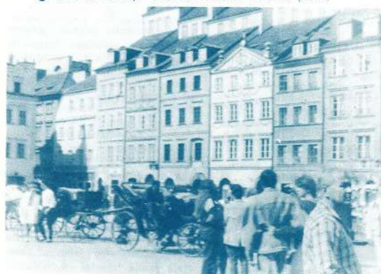
● Varšavas ratslaukums.