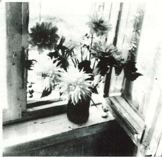
Krāšņu ziedu pušķi ir neapstrīdama tuva rudens un mācību gada sākuma pazīme.

Sen iepļānotais rūpniecības sportists — uzņēmuma sporta kluba dalībnieks un sporta dzīves aktīvistu braucienis notiks. Konkrēti — no 2. līdz 11. septembrim uz Poliju dosies grupa rūpniecības volejbolistu un galda tenisa entuziastu. Viņi piedalīsies sacensībās kopā ar Vācijas, Čehoslovākijas, Polijas sportistiem. Paredzētas arī ekskursijas uz Varšavu un Lodzu.