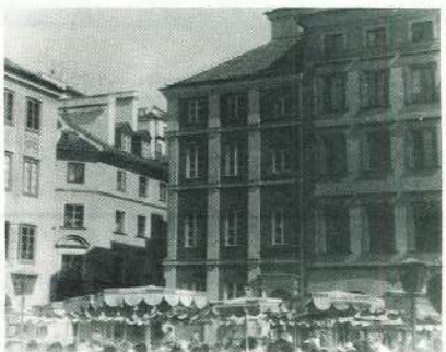
⊙ Poznaņas vecpilsēta