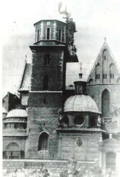
⊙ Krakova. Karaļa pils un baznīca.

Dažas stundas gulejuši, pamodāmie pulksten 2 naktī, lai dotos tālā un nogurdinošā ekskursija uz Krakovu. Nomazgājušies un paņēmuši līdz segas, somas un naudas makus, ejam uz autobusu. Tiklīdz atskan motora monotonā rūkopa, visi iemieg (izņemot šoferi). No dzijā miega lielāka grupas daļa pamostas tikai Veličkā — brauciena pirmajā galvenajā pieturšanas punktā.