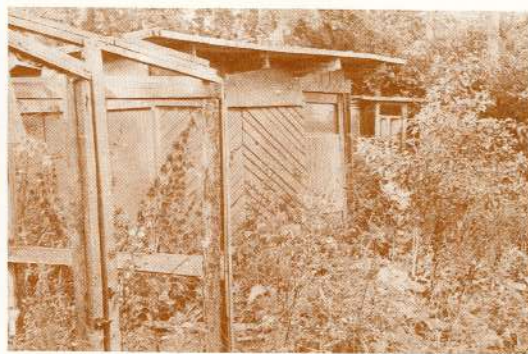
«Gauja» ir arī šādi darzi...