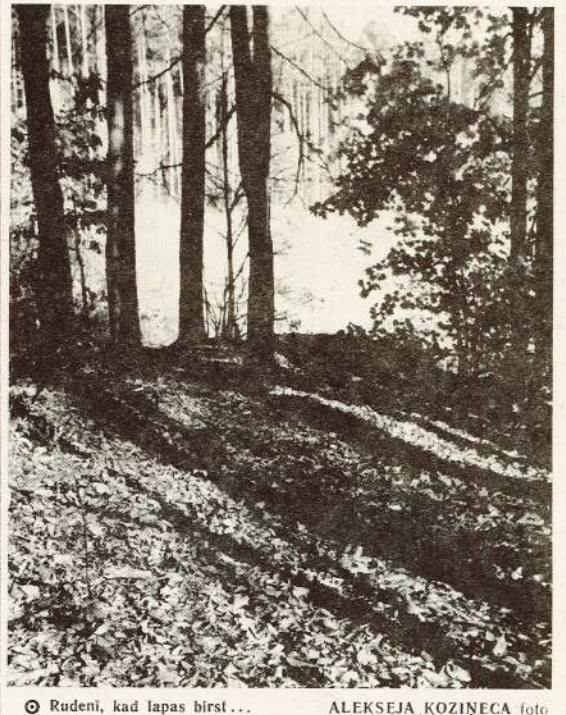
Rudeņi, kad lapas birst...

Redakcijas piebilde: otrdien notīkušajā operatīvajā sanāksmē tīka atzīmēts, ka aizvadītajā nedēļā traumas guvuši 3 strādnieki (12., 17. un 18. ceļā).