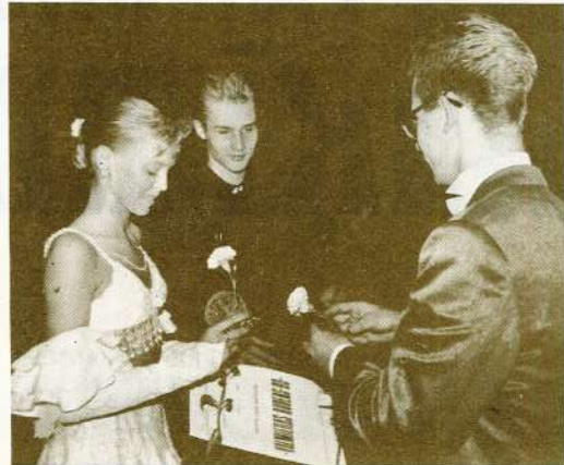
Valmieras kultūras namā 7. decembrī pl. 12.00 un pl. 16.00 notiks starptautiskais tradicionālais sporta deju konkurss «Valmieras rudens — 91». Piedalās dejojotāji no Latvijas, Igaunijas, Lietuvas, Krievijas un Baltkrievijas.

Konkursa sponsori: Vaidavas podnieku darbnīca, akciju sabiedrība «Gaujamielis», SIA «Sirius», sabiedriskās ēdināšanas apvienība kā arī mūsu STIKLA SKJEDRAS RŪPNICA.