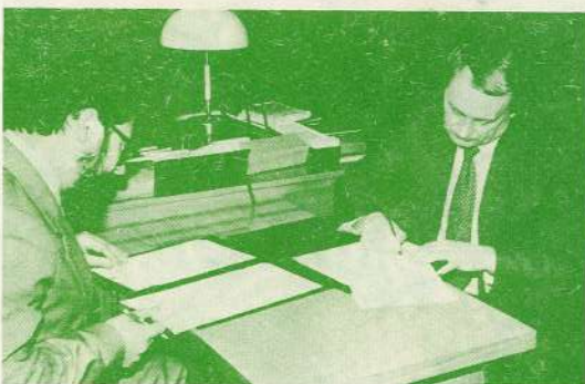
* Kontrakta parakstīšanas brīdis.