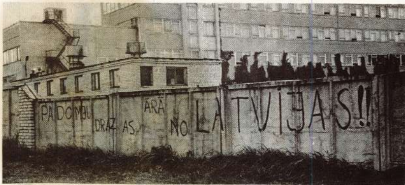
○ Tā izskatījās rūpniecības žogs akcijas rezultātā...