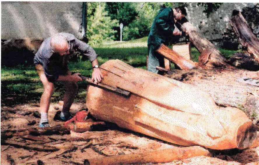
Turpinām sekot ozola blūka pārvērtībām. Ceturtais piegājiens.

No Rūjienas vestie ozola blūki pārtop par mākslas darbiem. Jaunie censoņi meistariem sākumā piepalīdzēja blūķīšu virsmas apstrādē, un tikai tad, kad prāts, roka un kalts spēja vienoties "kopējā dziesmā", viņiem tika sarežģītāki un smalkāki uzdevumi – ornamentu un burtu kalšana. Gumijas stiepšana koktēlniecības ievirzē nenotiek, jo nometnes noslēgumā no ozola blūka jābūt dzimušai vēl vienai Tautumeitai un Kurbadam.