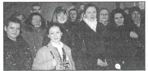
Dalībnieki autosalonā "Birums"

Vislielāko dalībnieku atsaucību izpelnījās psihologa nodarbības par pašapziņu, kā arī psiholoģiskiem faktoriem, kas var sekmēt veiksmīgu darba interviju. Tāpat jaunieši tikās ar Vidzemes augstskolas studentiem, kas stāstīja par augstākās izglītības iespējām Vidzemē un studentu spēju savienot darbu ar mācībām. Nometnes ietvaros da-