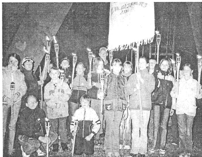
Skolas novadpētnieki akcijas „Iepazīsti sava novada kultūrvēsturiskās vērtības” nobeigumā Zilajākalnā.

Pagājušajā gadā izdevās kapitāli izremontēt un paplašināt skolotāju istabu, veikt kapitālo remontu krievu valodas kabinetā, nomainīt apgaismojumu atsevišķās klasēs, par pagasta piešķirtajiem papildus līdzekļiem iegādāties jaunus mēbeles un par testamen-