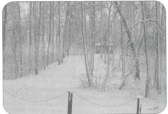
Ja iepriekšējos gados Zilaiskalns tika apmeklēts galvenokārt vasarā, tad pašlaik tūristu plūsma neapsīkst arī ziemas sezonas laikā.

Jāpiebilst, ka pēdējo gadu laikā Zilajamkalnais tiek apmeklēts tieši ar mērķi apciemot svētvietu, savukārt kalna virsotnes apkaimē atrodas unikāls dabas liegums un šī iemesla dēļ kalns kļuvis vienlaikus par sakrālā, rehabilitācijas un arī atpūtas tūrisma objektu. ①