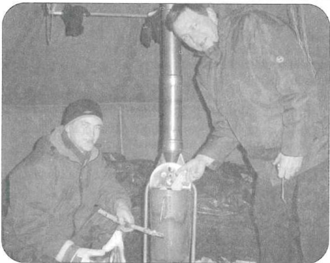
Kocēnu un Valmieras skauti vienības kopīgā nometnē Ložmetējkalnā.