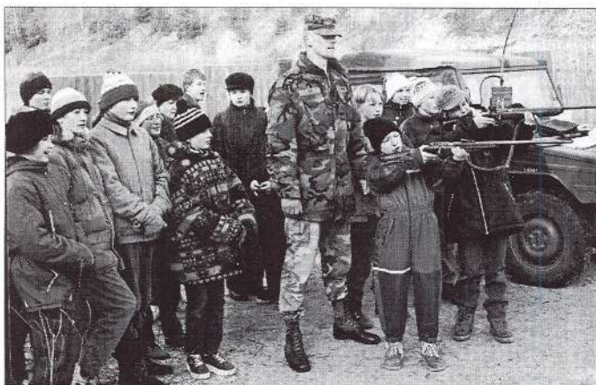
Lāčplēša dienā Kocēnu pamatskolas skolēni piedalījās šķēršļu gājienā. Viens no uzdevumiem bija šausana.