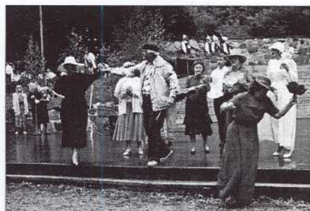
Kocēnu pašdarbnieku pulkā vieni no aktīvākajiem ir dramatiskā kolektīva ļaudis. Šādos krāšņos tērpos viņus vērojām izrādē «Pasakas par ziediem».