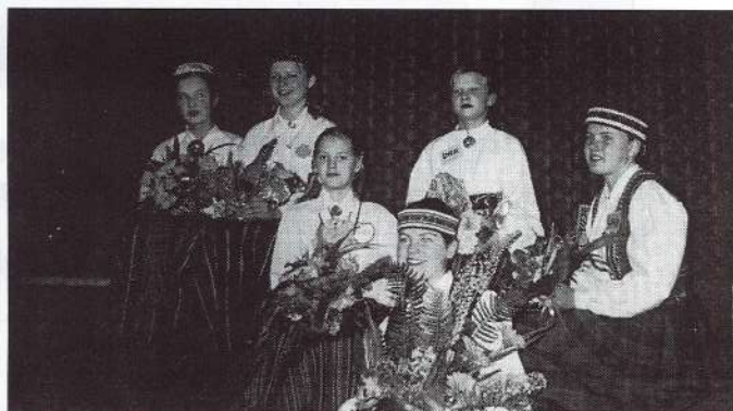
Jau vairākus gadus martā skola aicina ciemos draugus no lauku pamatskolām. Atpūtas vakars «Mazā zeltene» jau ieguvusi tradicionālu nokrāsu. Paldies sakām visiem, kas nāk mums talkā, veidojot šo pasākumu, un ceram uz tālāku sadarbību!