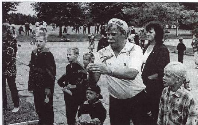
Par tradīciju jau ir kļuvis 2 reizes gadā gan lieliem, gan maziem satikties sporta sacensībās. Vasarā Kocēnu centrā, bet ziemā - Rubenes sporta zālē.