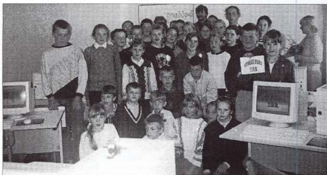
Datori ir ienākuši arī mūsu skolas ikdienā. Skolēnu pateicība skolas vadībai un pagasta pašvaldībai!