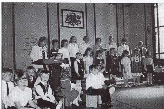
Mēs esam maza tauta, bet lai neesam mazi savās domās, jūtas un centienos, lai apzināties, ka Latvija sākas mūsu sakoptajā sētā, mūsu labajos darbos, mūsu tīrjā sirdsapziņā, mūsu rūpēs par mazajiem «Auseklišiem» - brīvas Latvijas laika bērniem.

KĀRLIS SKALBE, 18. novembrī 1919. gadā Lielā diena ir klāt. Nolieciet savas galvas kritušo varoņu priekšā. Nav neviena akmens neatkarīgās Latvijas pamatos, kurš nebūtu tur iemūrēts ar viņu asinīm kā ar nesagraujamu cementu. Un, ja mēs savas republikas gada dienā cietāk varam nostāties uz savas zemes, tad mums jāpateicas tai klusai pazemei, kurā iegājuši tikdaudz nesavtīgu brīvības cīnītāju, lai uz saviem stipriem pleciem paceltu pret sauli neatkarīgo Latviju. Kā bērns es šodien atkal ticu tiem labsirdīgiem milžiem, par kuriem stāsta tautas pasakas, kas visā klusībā tur kalnus uz pleciem ar puķēm un kokiem, kuros šūpojas gavilējoši putnu kori. Šīs dienas to pierāda, ka šie krietnie milži vēl dzīvo mūsu tautā. Ir ļaudis, kam ir prieks uz sauli skatīties, un ir ļaudis, kam ir vēl lielāks prieks noliekties, ņemt bērņus uz pleciem, lai viņi uzgavilē saulei. Šo zemi mēs iekarojām priekš saviem bērniem. Mums pieder darbs un ciņās, nākošām paaudzēm - gaišais saules mantojums. Un tomēr, neskatoties uz