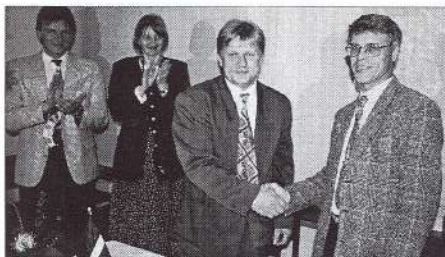
Pēdējos gados Kocēnu pagastam ir izveidojusies sadarbība ar ārvalstu pašvaldībām. Mūsu sadarbības partneri ir gan Vācijā, gan Zviedrijā. Šajā fotogrāfijā redzams, kā tiek parakstīts līgums ar Torsosas - Bergkvāras pārstāvjiem no Zviedrijas.