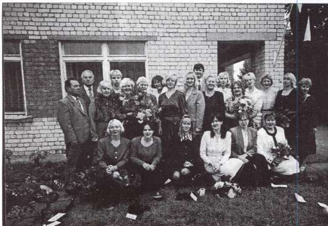
Rubenes pamatskolas kolektīva pateicas tiem bērnu vecākiem, kuri ar sapratni ir izturējušies pret skolas prasībām, ir nākuši ar savu ierosmi un palīdzību. Valsts svētkos novēlam visiem pagasta iedzīvotājiem spēju ticēt labajam un dāvat prieku sev un citiem!