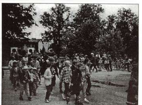
Sporta svētki kļūst arvien populārāki.