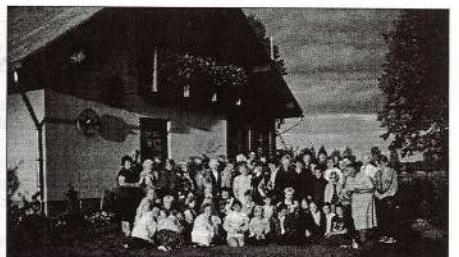
Kādā no cimošanās reizēm kocēnieši priecājās par JĀŅA LOČMEĻA saimniecību.