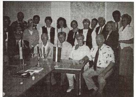
Uzņēmām vācu draugu delegāciju no Tangstedas.